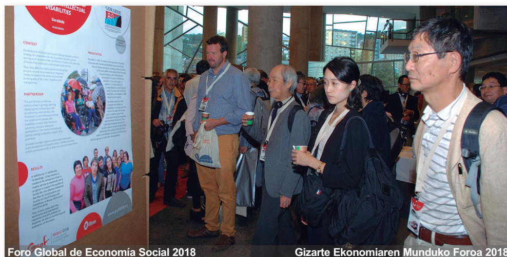
Foro Global de Economía Social 2018