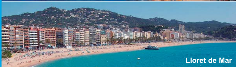
Lloret de Mar

Vacaciones de pascua con el Imsero y Plena inclusión pg. 5