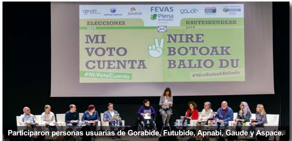
Participaron personas usuarias de Gorabide, Futubide, Apnabi, Gaude y Aspace.

Con el objetivo puesto en las elecciones forales del 26 de mayo, las cinco entidades vizcainas de Fevas Plena Inclusión Euskadi preparamos un encuentro entre personas con discapacidad intelectual, familias y representantes de los partidos políticos que tienen presencia en las Juntas Generales de Bizkaia, para abordar las necesidades y reivindicaciones de nuestro colectivo. Las personas usuarias aludieron a temas como accesibilidad cognitiva y lectura fácil, empleo, salud, vivienda, educación, transporte, justicia, ocio o cultura, con un mensaje muy claro: “queremos que nos escuchen y nos faciliten la participación, para que podamos decidir el futuro” . Las familias plantearon cuestiones como el sobreesfuerzo económico que sufren,