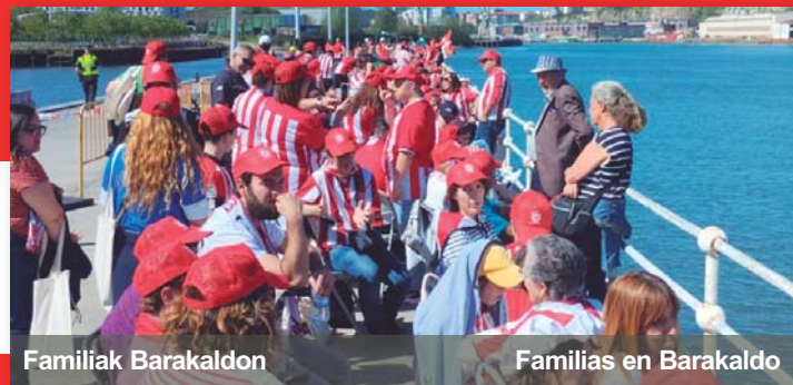
Familiak Barakaldon Familias en Barakaldo