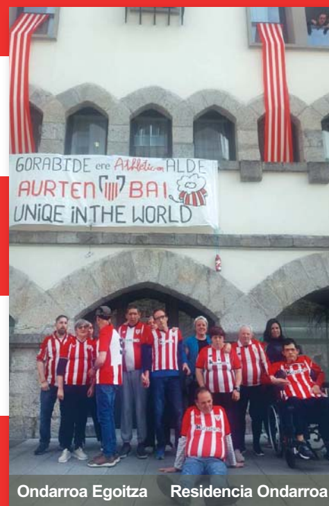
Ondarroa Egoitza Residencia Ondarroa