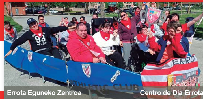
Errota Eguneko Zentroa Centro de Día Errota