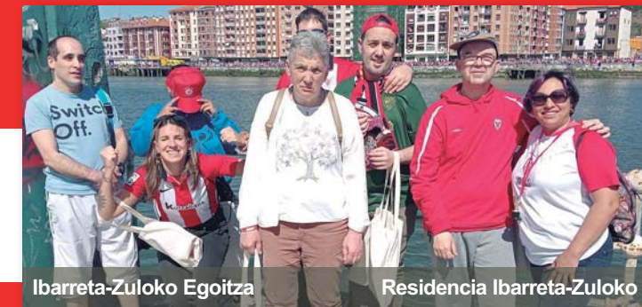
Ibarreta-Zuloko Egoitza Residencia Ibarreta-Zuloko