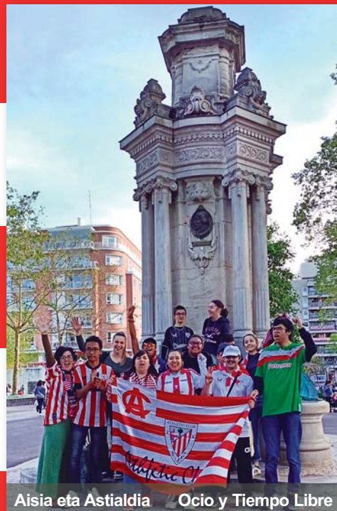
Aisia eta Astialdia Ocio y Tiempo Libre