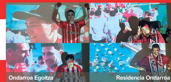
Ondarroa Egoitza Residencia Ondarroa