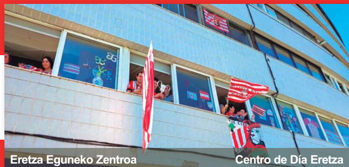
Eretza Eguneko Zentroa Centro de Día Eretza