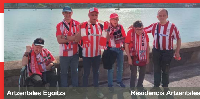
Artzentales Egoitza Residencia Artzentales