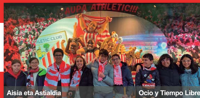
Aisia eta Astialdia Ocio y Tiempo Libre