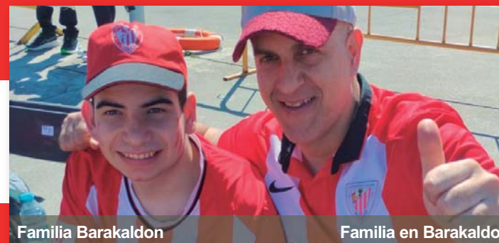
Familia Barakaldon Familia en Barakaldo