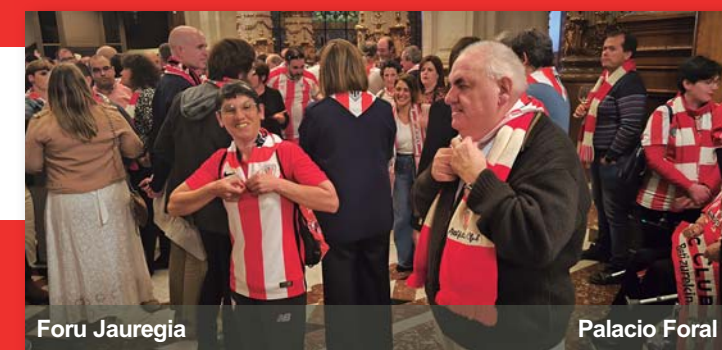
Foru Jauregia Palacio Foral