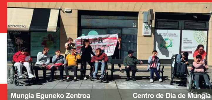
Mungia Eguneko Zentroa Centro de Día de Mungia