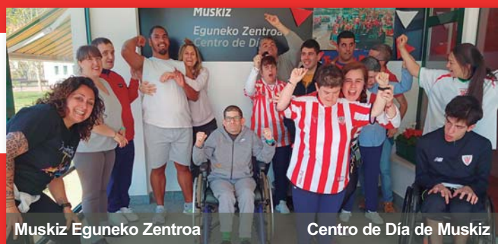
Muskiz Eguneko Zentroa Centro de Día de Muskiz