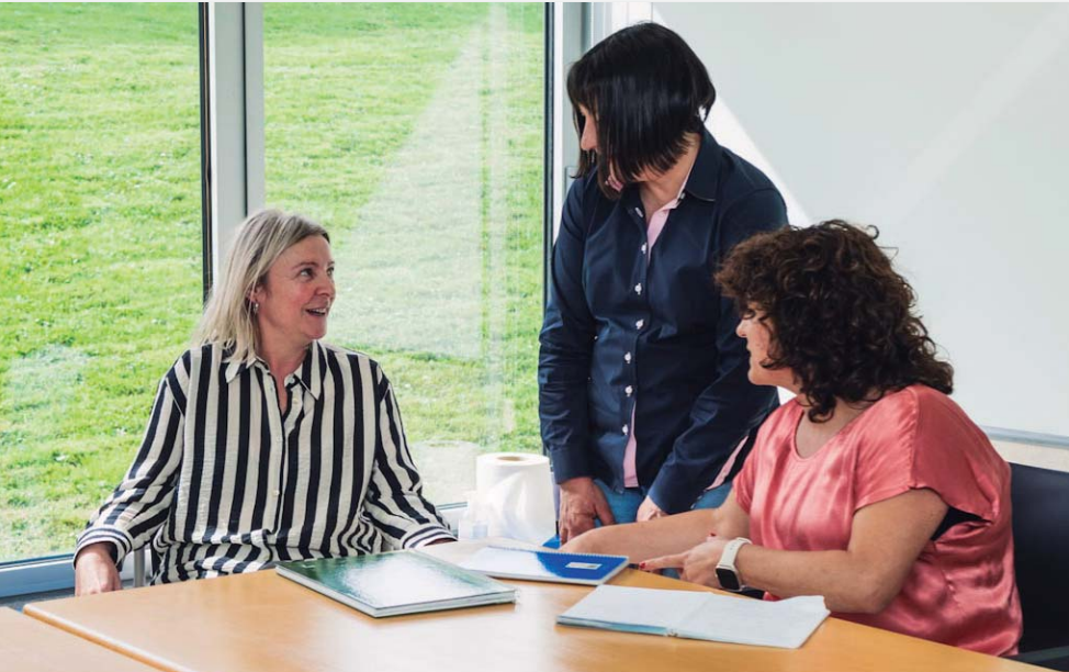
Gure BBK SAIOA GORABIDE taldea bost gizarte-langilek, bi psikologok, psikiatra batek, administrari batek eta zuzendari batek osatzen dute, guztiak emakumeak.

Gure harrera, informazio, orientazio eta laguntza taldeari buruzko berariazko galdera-sorta batekin hasi da hamargarren inkesta