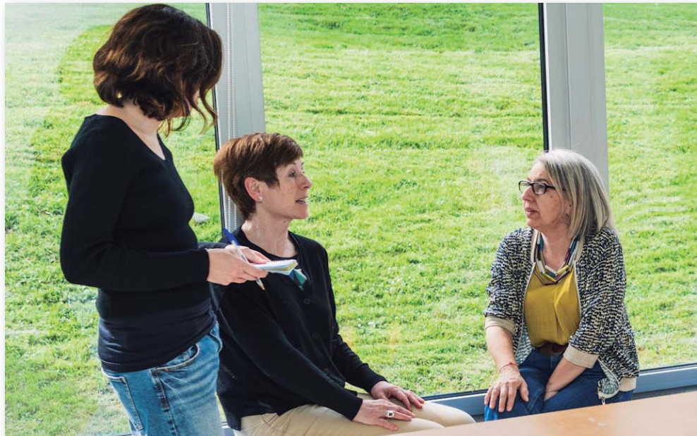
Nuestro equipo BBK SAIOA GORABIDE está formado por cinco trabajadoras sociales, dos psicólogas, una psiquiatra, una administrativa y una directora.

El aspecto más puntuado en la encuesta de satisfacción ha sido la atención y el trato que ofrece en general nuestro equipo de profesionales, que ha alcanzado un 4,44 sobre 5 y supera el valor registrado en la encuesta anterior. Lo sigue en relevancia una de las cuestiones evaluadas por primera vez en esta ocasión: la atención y el apoyo recibido específicamente en relación con el asunto por el que la familia contactó con