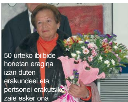
50 urteko ibilbide honetan eragina izan duten erakundeei eta pertsoneri erakutsiko zaie esker ona