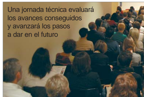
Una jornada técnica evaluará los avances conseguidos y avanzará los pasos a dar en el futuro