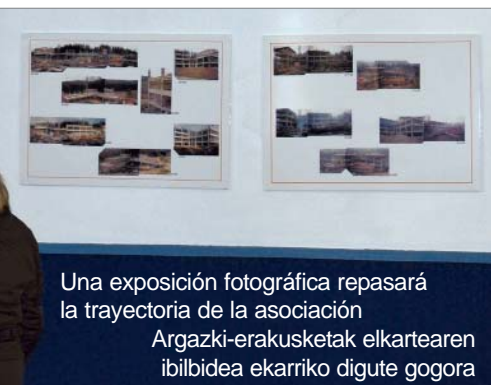
Una exposición fotográfica repasará la trayectoria de la asociación

Argazki-erakusketak elkartearen ibilbidea ekarriko digute gogora