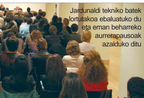
Jardunaldi tekniko batek lortutakoa ebaluatuko du eta eman beharreko aurrerapausoak azalduko ditu