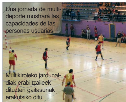
Una jornada de multideporte mostrará las capacidades de las personas usuarias