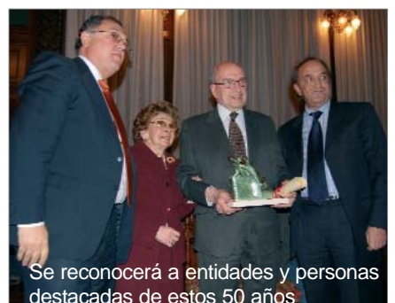
Se reconocerá a entidades y personas destacadas de estos 50 años