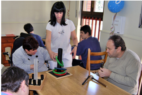
La zona de talleres formó parte del recorrido.

La visita continuó por el exterior, dando un paseo por parte del entorno natural que rodea a la residencia, antes de volver a acceder al centro por la entrada principal. Al terminar el recorrido, las personas que participa-