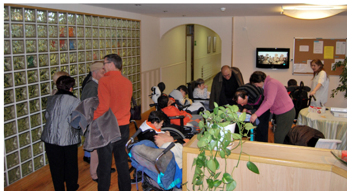
Familias y residentes disfrutaron de la jornada de puertas abiertas.

cada vez que acude a la residencia, en Reyes. Y abogó por “no bajar el pistón y seguir aportándoles lo mismo y, si es posible, mucho más”.