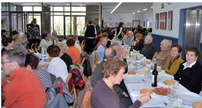
Familiares y personal de Gorabide compartieron mesa en Atxarte.

ron en la jornada de puertas abiertas disfrutaron de un lunch, así como de la exposición en la que se aprecia la evolución de las obras de Atxarte, desde 1981 hasta 1984, con bocetos, fotografías, documentos y recortes de prensa.