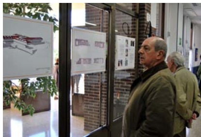
La exposición reúne material histórico.

ron en la jornada de puertas abiertas disfrutaron de un lunch, así como de la exposición en la que se aprecia la evolución de las obras de Atxarte, desde 1981 hasta 1984, con bocetos, fotografías, documentos y recortes de prensa.