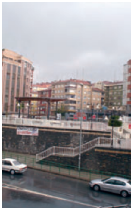
Kabiezesez ekipamendu komunitario onak ditu