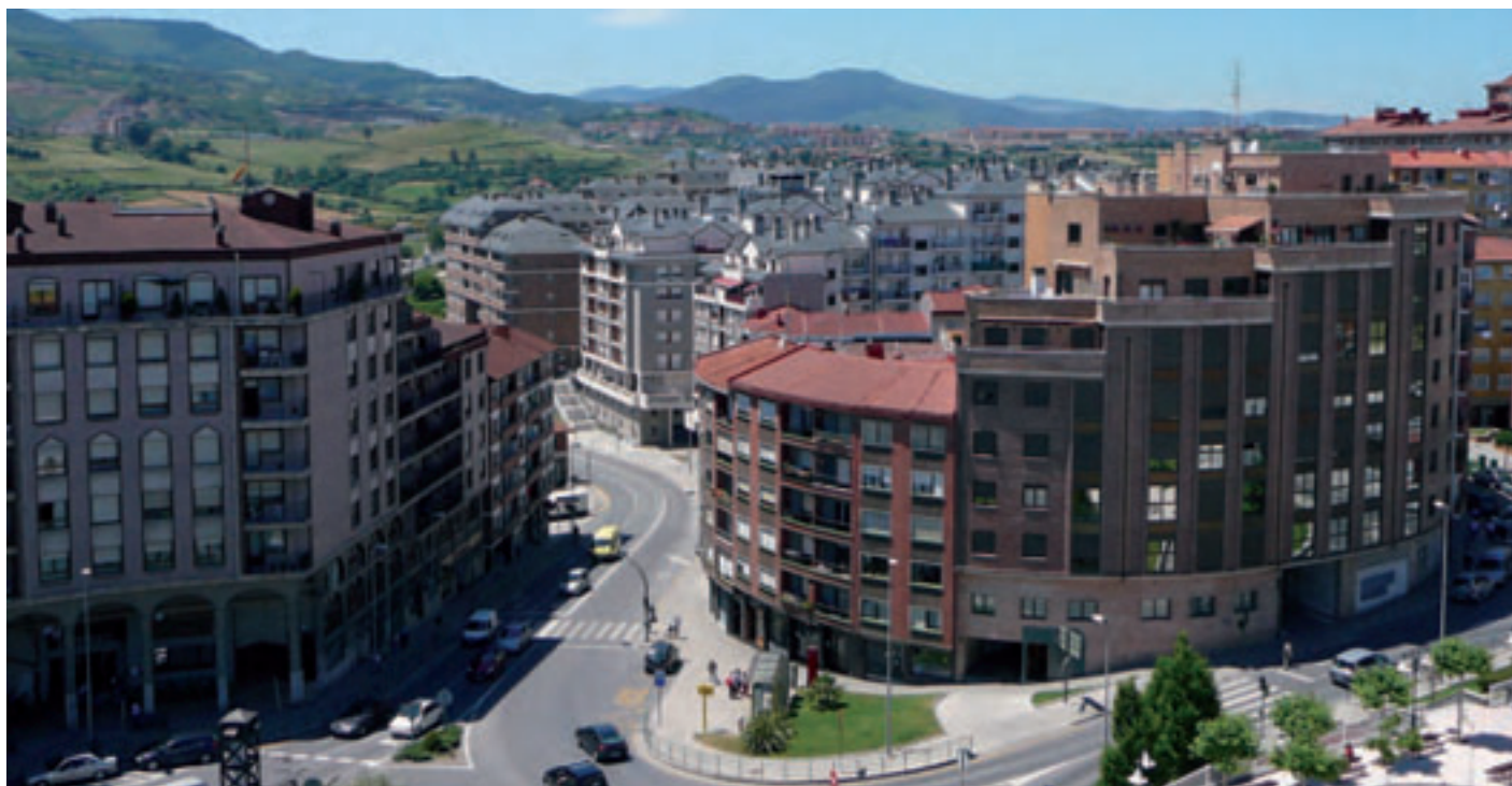
Vivienda en Santurtzi