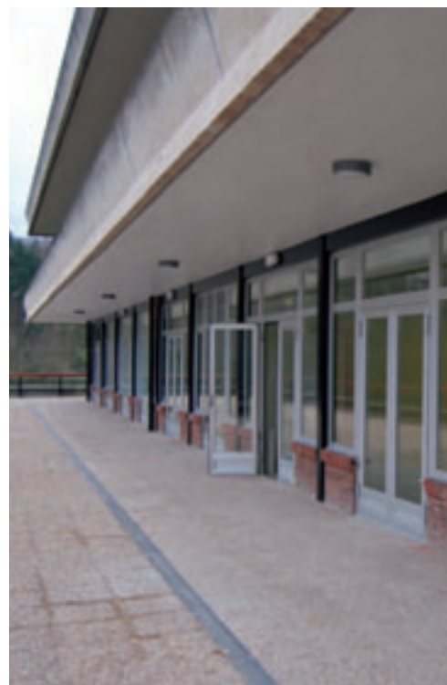
Centro de día en Sondika