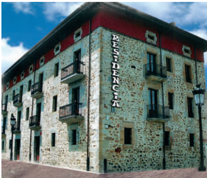
Residencia en Artzentales