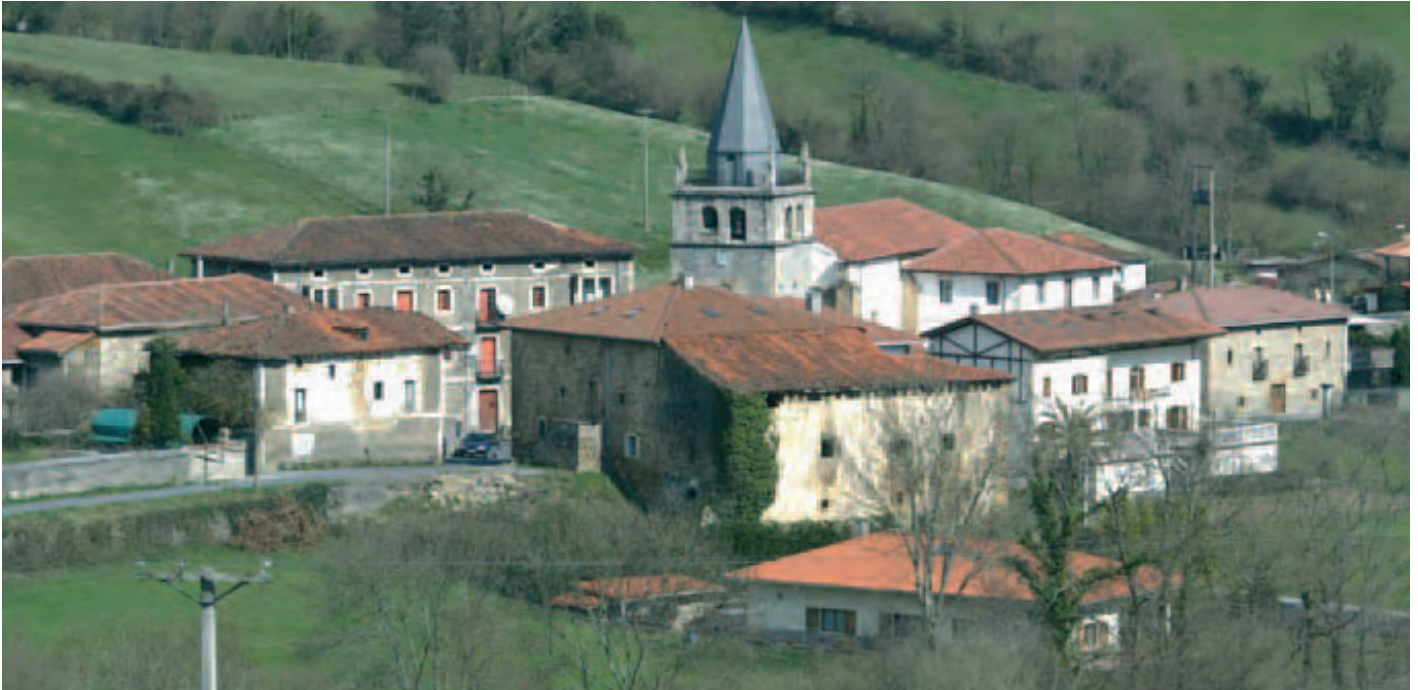
La Residencia de Arcentales tendrá capacidad para 25 personas mayores de edad, a las que se les ofrecerá un servicio integral, con atención las 24 horas del día.