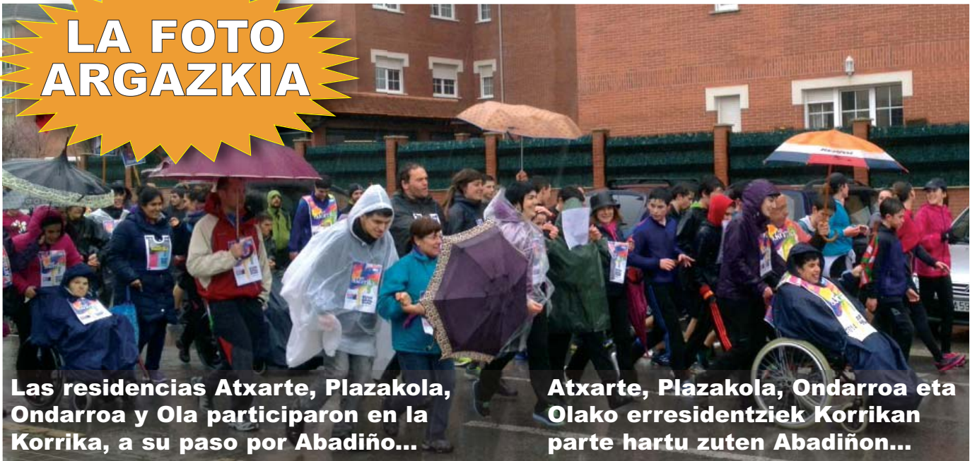
Las residencias Atxarte, Plazakola, Ondarroa y Ola participaron en la Korrika, a su paso por Abadiño...