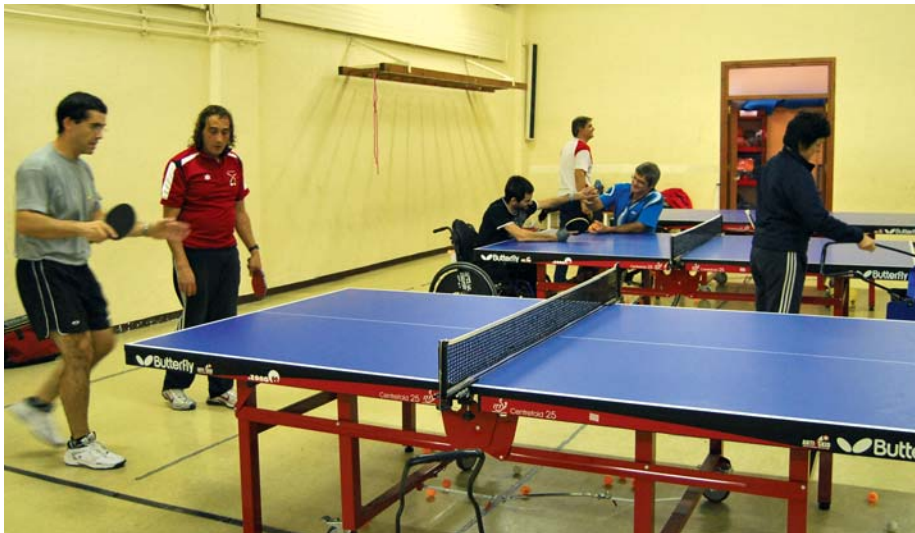
Andrésék astean hiru aldiz entrenatzen du, Fekooren mahai-tenis talde egokituarekin.