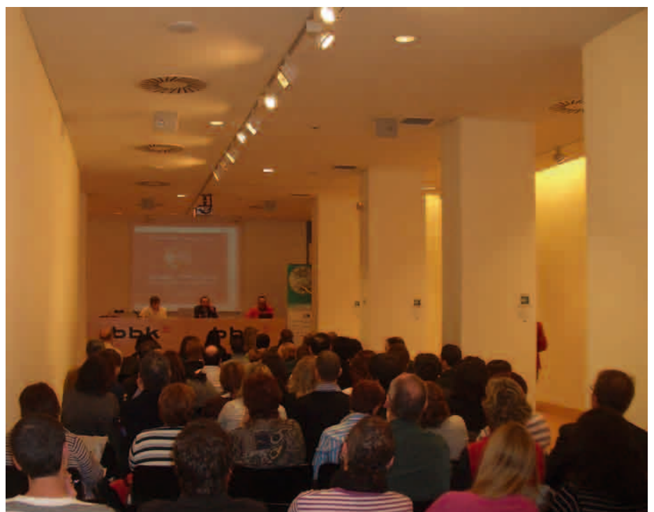
En una de las ponencias del año pasado, se explicó el Proyecto de Desarrollo de la Ética en Gorabide

con amplia trayectoria en mejorar la calidad de vida de las personas en los ámbitos sociales y laborales.