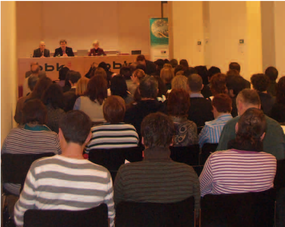
lazko jardunaldien inaugurazio ekitaldian Gizarte Ekintzako foru diputatua egon zen