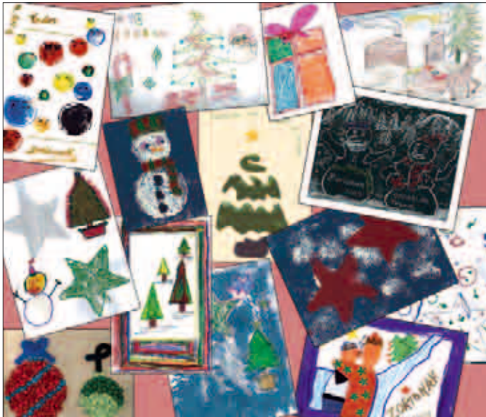
Los trabajos del año pasado demostraron la capacidad de las personas que participaron lazko lanek argi erakutsi zuten parte hartzaileen gaitasuna

Como ya hicimos el año pasado, estas navidades volveremos a tener nuestras propias postales para felicitar las fiestas. Las personas usuarias de las residencias, centros de día y clubes de tiempo libre ya han empezado a crear varios modelos, de los que se elegirá uno por cada servicio. En el Berriak de diciembre, reproduciremos las tres postales seleccionadas, para deseáros unas felices fiestas desde estas páginas.