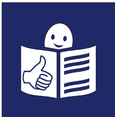
Figura 2. Logotipo europeo de lectura fácil diseñado por Inclusion Europe para la identificación de este tipo de textos.

En 1998 elaboró la guía «El camino más fácil: Directrices europeas para generar información de fácil lectura destinada a personas con discapacidad intelectual», en la que propone las pautas para desarrollar un proyecto de redacción original o la adaptación de textos a esta técnica. Además, diseñó un logotipo europeo de lectura fácil, para identificar todos los textos redactados que siguieran sus pautas. Además de la web, ha redactado textos informativos en lectura fácil en 20 lenguas europeas. En español, ha publicado textos legales, como la «Directiva europea a favor de la igualdad de trato en el empleo y la ocupación»; informativos sobre derechos, como «Tus derechos como ciudadano: El acceso a la justicia de las personas con discapacidad intelectual» o «Sé lo que quiero, sé lo que compro»; e informativos sobre instituciones internacionales, como la Unión Europea o la ONU.