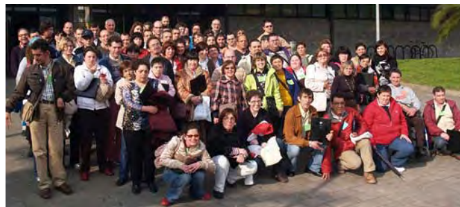
Los autogestores de Euskadi expresaron sus inquietudes.

Aproximadamente, cien participantes debatieron, en el 5º Encuentro de Autogestores de Euskadi, sobre los temas que más les preocupan. Tras la jornada, que se celebró el 9 de mayo en Donostia, expusieron sus conclusiones.