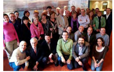
Directivos de las asociaciones de Fevas.

Esta jornada es una de las acciones que se están desarrollando en Fevas y en las asociaciones que integra con motivo del con-