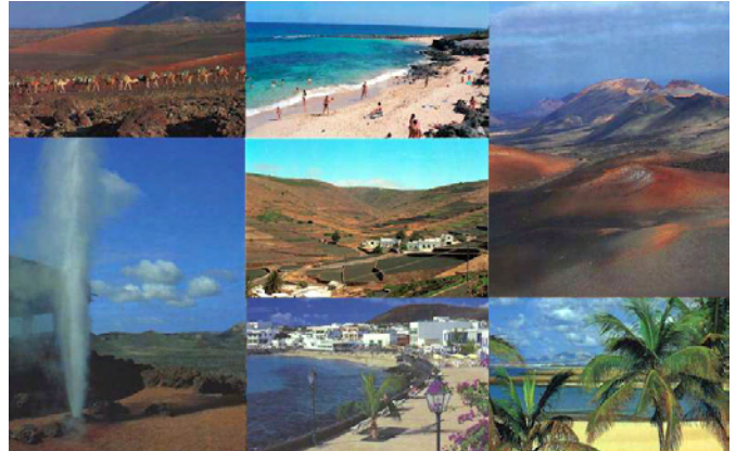
Lanzarote es el destino de uno de los viajes de septiembre

Al igual que en años anteriores, se ha establecido un baremo de admisión, por si el número de solicitudes presentadas fuera superior al de las plazas disponibles.